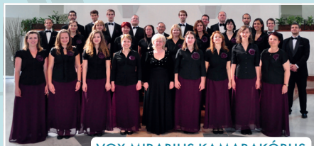
VOX MIRABILIS KAMARAKÓRUS