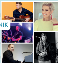
LATIN JAZZ PIKNIK