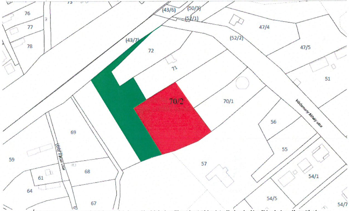
Új beépítésre szánt terület (piros szín) és az új védelmi erdőterület (zöld szín) elhelyezkedése Kápolnásnyék területén