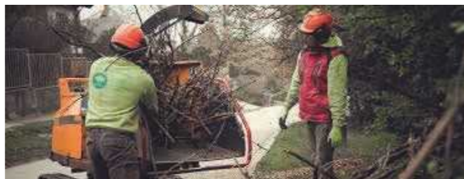
/a kép illusztráció/