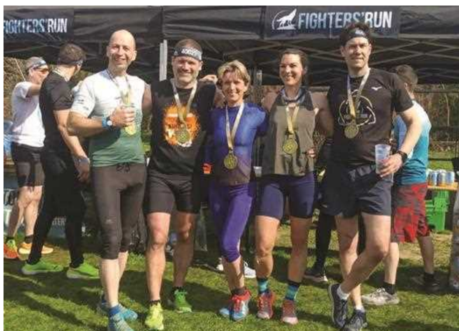
Boldog mosoly a célban