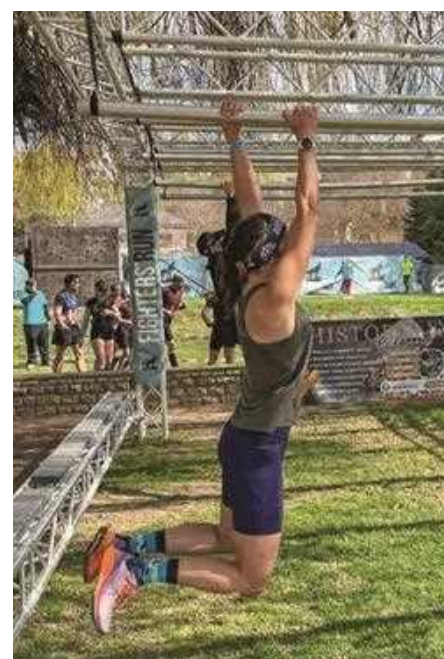
Nóri a hosszú hintán