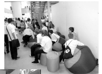
babzsák fotelek az aulában