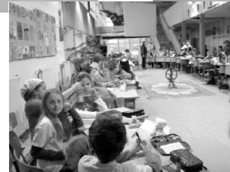
meseverseny az aulában 2011. december 1.