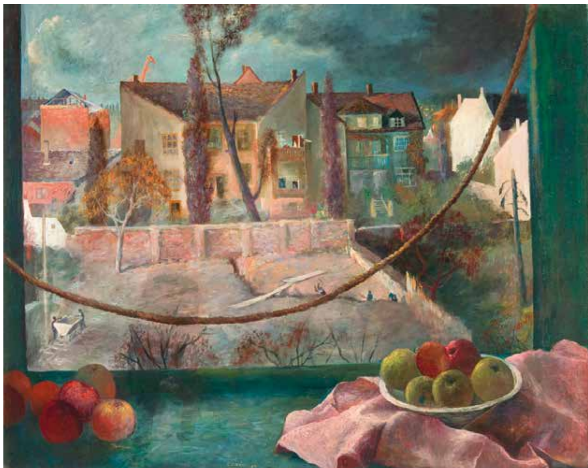
Cziráki Lajos: Kilátás az ablakból

A FESTÉSZET GYŐRI MESTEREI CZIRÁKI LAJOS (1917–2003) és TÓVÁRI TÓTH ISTVÁN (1909–2004) válogatott alkotásai