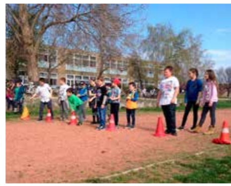
A lebonyolítók, 12. b osztály