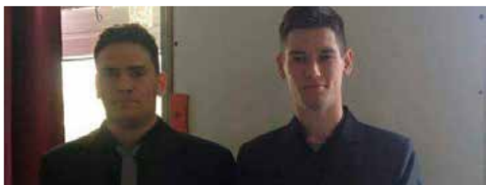
Diákigazgatónk (balra) és helyettese (jobbra)

Szokásainkhoz híven a végzős osztályokból választottuk ki a diákigazgatót és helyettesét. Ám az utóbbi évektől eltérően, komoly kampánymunka folyt iskolánkban a végzős osztályaink jóvoltából. Ehhez számos kampány videó, plakát, fénykép, szórólap