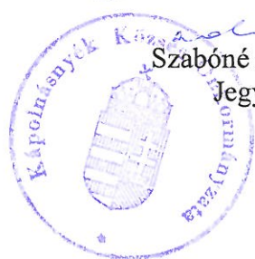
Szabóné Ánosi Ildikó Jegyző

1. melléklet: a 10/2019.(VIII.17.) önkormányzati rendelethez: Szabályozási tervlap