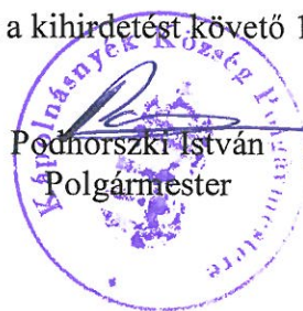
Podhorszki István Polgármester

3. § Jelen rendelet a kihirdetést követő 15. napon lép hatályba.