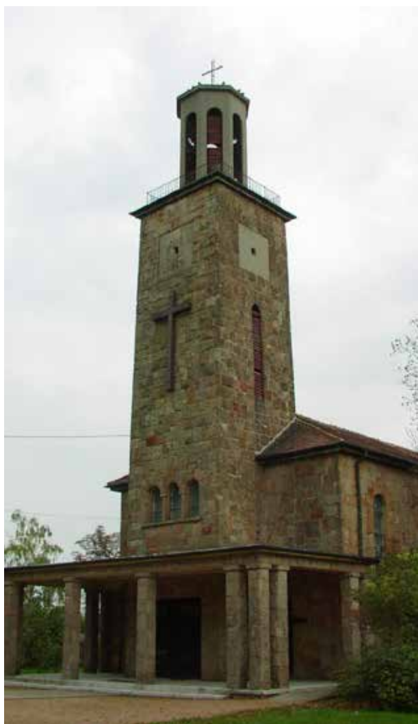
/ Katolikus templom, Kápolnásnyék/