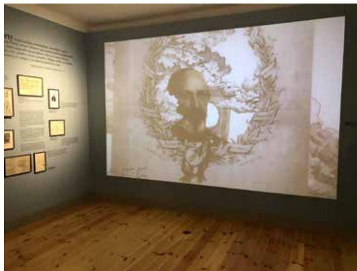
/ Vörösmarty Mihály Emlékház /