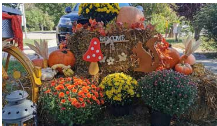
/ Kovács Brigitta Fő utca Anya-tanya használtruha üzlet /

Érdeemes lehet egy szép őszi napon felkeresni akár valamennyit, de addig is mutatunk egy kis fotós ízelítőt a jókedvre hangoló alkotásokból.