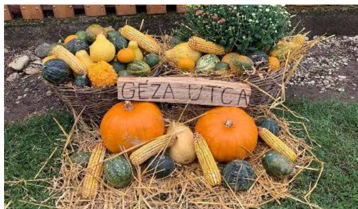
/ Mocsáriné Faragó Erzsébet Géza utca /