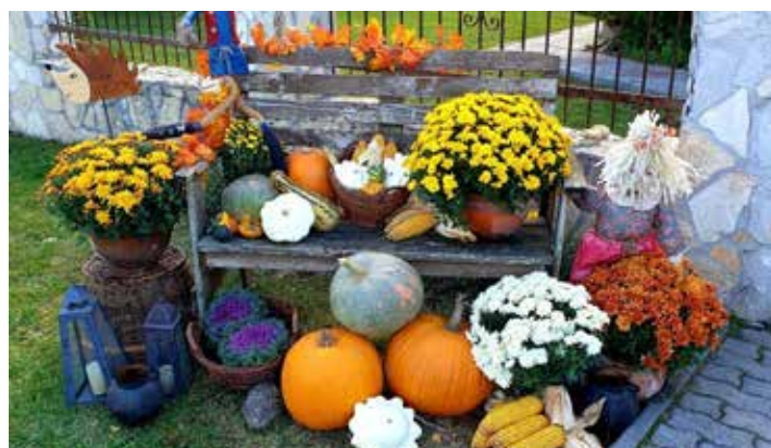
/ Reichenbach Dóra, Ady utca /