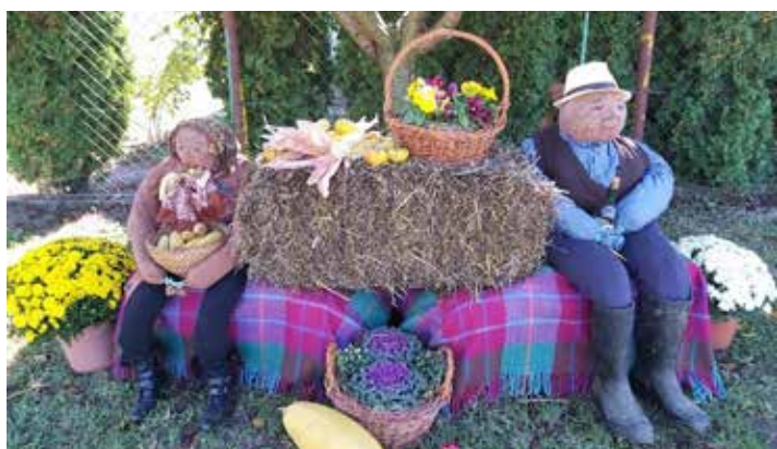
/ Faragóné Szabó Szilvia Géza utca /