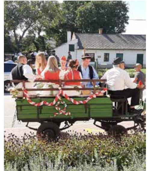
/ Indulás előtti gyülekező a Deák Ferenc utcában /