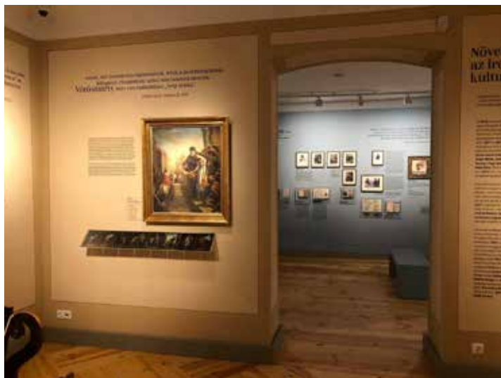
/ Vörösmarty Mihály Emlékház /