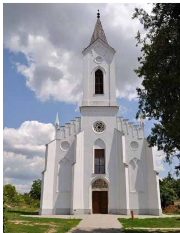
/ Református templom, Kápolnásnyék/

December 6-án vasárnap 10 órakor Advent 2. vasárnapi istentisztelet