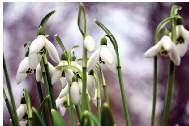
Kikeleti hóvirág (Galanthus nivalis)

zása, a felmelegedés itt is látható változásokhoz vezet , a korábban csak februárban nyíló növények nem ritkán – mint idén is – már január elején, sőt akár december végén virágba borulnak. A Kisvirágú hunyor mérgező növény , minden része tartalmaz a gyűszűvirág hatóanyagához hasonló alkaloidokat, így ne kóstolgassuk! Rokona a nálunk nem őshonos , kertészetekben kapható Fekete hunyor (Helleborus niger) , másnéven karácsonyi rózsza. Nevét fekete színű gyöktrészéről kapta, a virág színe gyönyörű hófehér, ősszel cserépbe ültetve karácsony körül virágzik. A Kikeleti hóvirág (Galanthus nivalis) talán a legismertebb korai virág, szintén védett, eszmei értéke 10.000 forint , amely egy szál virágra is érvényes. A védelem természetesen nem csak a növény föld feletti részére, a száras virágra, hanem a földalatti hagymákra is vonatkozik, így virágzás utáni kiásásuk is tilos! A kertészetekben kapható hóvirágok nem a nálunk őshonos Kikeleti hóvirág fajhoz tartoznak, vásárlásukkal kertünkben is meghonosíthatjuk a hóvirágot, ezeknek a dísznövényként árut fajoknak általában nagyobb és díszesebb is a virága, mint vadon élő társaiké. Az évtizedekkel ezelőtti szinte országosan kiterjedt hóvirág pusztításnak nemcsak a növények nagyfokú ritkulása, hanem részben genetikai állománya is áldozatul esett, hiszen a hóvirág hagymákat gyűjtők természetesen a legszebben virágzó,