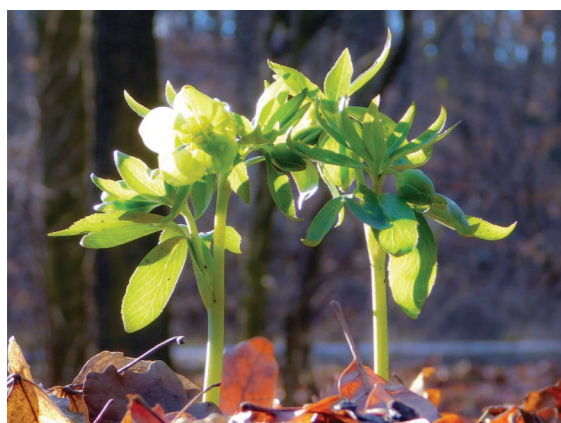
Kisvirágú hunyor (Helleborus dumetorum)