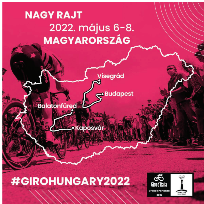
A magyarországi Giro d'Italia szakaszok

Az első szakaszon érkeznek majd a mezőny Kápolnásnyékre is Tárnok felől a 7-es főúton, majd a kerékpárosok Pázmánd felé haladnak át településünkön. Május 7-én, szombaton egy 9,2 km hosszú egyéni időfutam lesz Budapest szívében. A verseny a Hősök teréről indul és a Budai Várba érkeznek. A harmadik, egyben utolsó magyar szakasz május 8-án, vasárnap startol Kaposvárról, és Nagykanizsán, Badacsonyon, valamint Tihanyon át Balatonfüredig teker majd a mezőny. A versenyzők a harmadik magyar szakasz után visszatérnek Olaszországba, majd egy pihenőnap után május 10-én folytatják a versenyt.